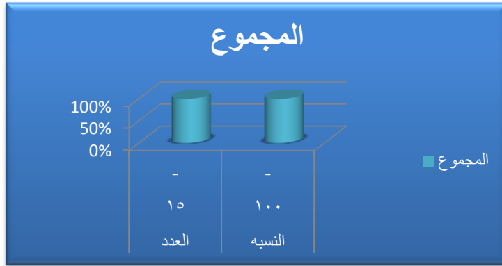
الشكل رقم (٣) جميع افراد العينه من حملة درجة الدكتوراه